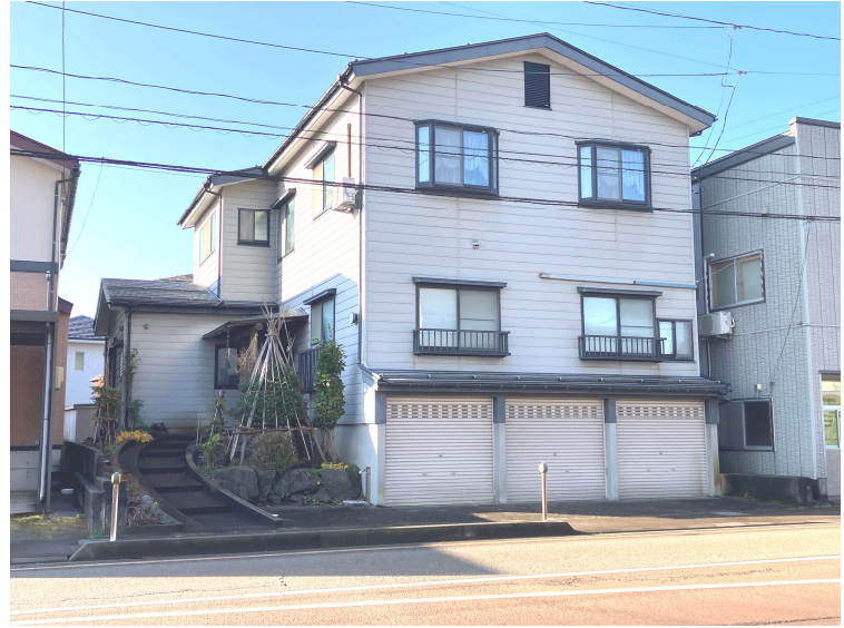
西側に物置があります